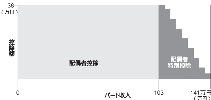
配偶者控除と配偶者特別控除の関係

亡くなった人の配偶者が相続や遺贈により実際に取得した正味の遺産額が、次の金額のいずれが多い金額までであれば、配