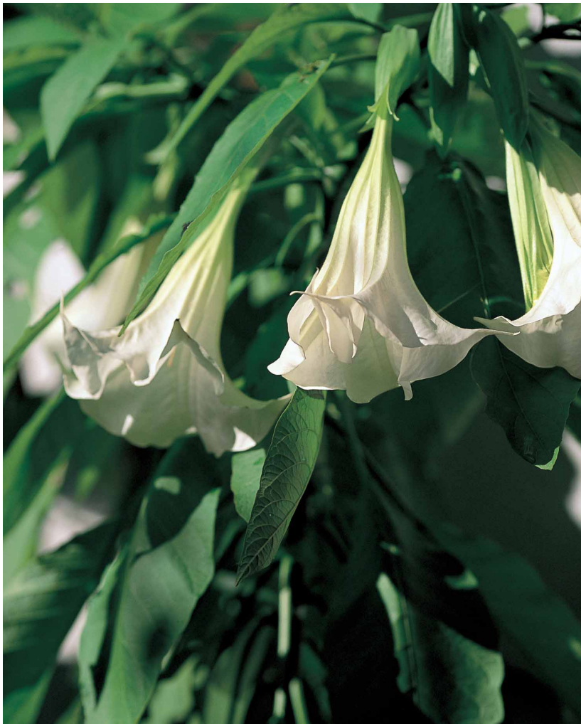
トランペットフラワー